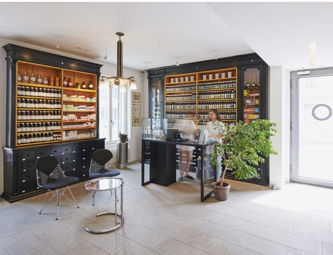
Einblick in die Offizin (Verkaufsraum) der Bahnhof Apotheke Langnau AG